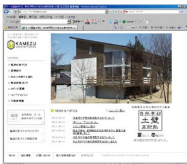
制作事例の一例 (亀津建築様)

URL : http://www.dipross.co.jp/web mail : web@dipross.jp tel : 052-857-0121 (代表)